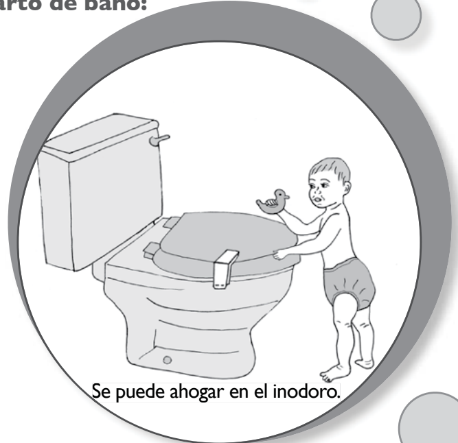
Se puede ahogar en el inodoro.

Carmen sabía que a Carlos le gusta jugar con agua y él trataría de entrar en el baño cuando ella no lo esté mirando. Carmen compró algunos artículos de seguridad que hacían más difícil que Carlos entre en apuros. ❖