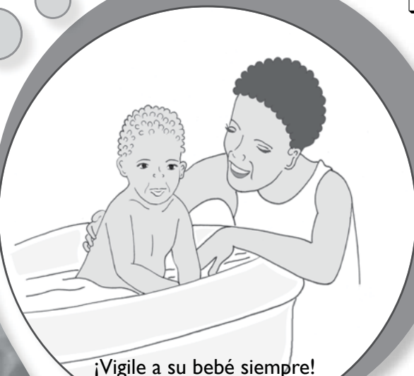
¡Vigile a su bebé siempre!

Cristina sabía que era peligroso dejar solo a su hijo en la bañera. Un niño de los vecinos se ahogó el año pasado cuando la madre lo dejó en la tina para contestar el teléfono. Así que Cristina cogió a Manuel para sacarlo fuera de la bañera, lo envolvió en la toalla mojada y lo tomó con ella para agarrar una toalla seca del armario del vestíbulo. ❖